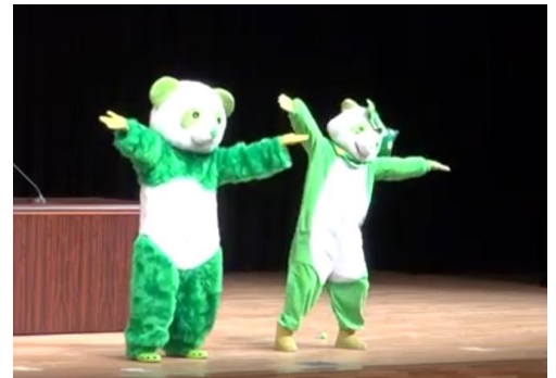
↑ 踊るススミンとススミン