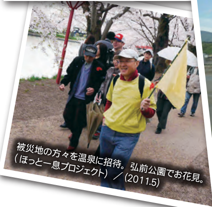
被災地の方々を温泉に招待。弘前公園でお花見。（ほっと一息プロジェクト）／（2011.5）